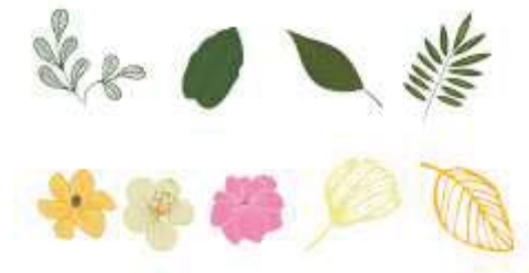
ภาพที่ 15 ลวดลายแบบที่ 5.1