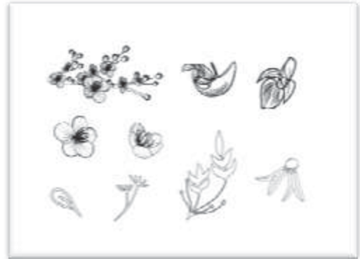
ภาพที่ 8 ลวดลายแบบที่ 3

3. ลวดลายที่ 3 เป็นรูปแบบกราฟิกที่ออกแบบโดยการถอดรูปมาจากดอกทองกวาว ซึ่งเป็นดอกไม้ในวรรณคดี และยังมีดอกมะขามป้อมที่นำมาประกอบ มีทั้งหมดสองดอก นำมาตัดทอนเป็นรูปแบบกราฟิกและมีลายละเอียดของดอกไม้ โดยใช้โทนสี ขาว ส้ม ของดอกทองกวาว นำกราฟิกมาจัดวางเป็นแพทเทิร์น พัฒนาเป็นผลิตภัณฑ์ผ้าพันคอ และหมวกแก๊ป