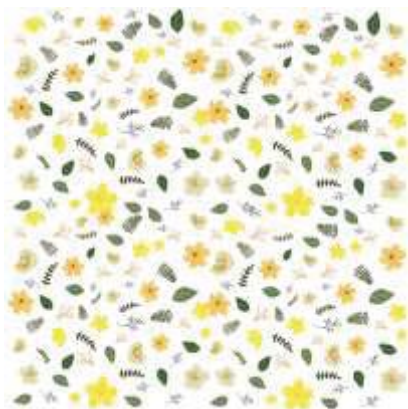
ภาพที่ 7 ลวดลายลวดลายแบบที่ 2.2

3. ลวดลายที่ 3 เป็นรูปแบบกราฟิกที่ออกแบบโดยการถอดรูปมาจากดอกทองกวาว ซึ่งเป็นดอกไม้ในวรรณคดี และยังมีดอกมะขามป้อมที่นำมาประกอบ มีทั้งหมดสองดอก นำมาตัดทอนเป็นรูปแบบกราฟิกและมีลายละเอียดของดอกไม้ โดยใช้โทนสี ขาว ส้ม ของดอกทองกวาว นำกราฟิกมาจัดวางเป็นแพทเทิร์น พัฒนาเป็นผลิตภัณฑ์ผ้าพันคอ และหมวกแก๊ป