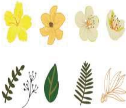
ภาพที่ 6 ลวดลายลวดลายแบบที่ 2.1