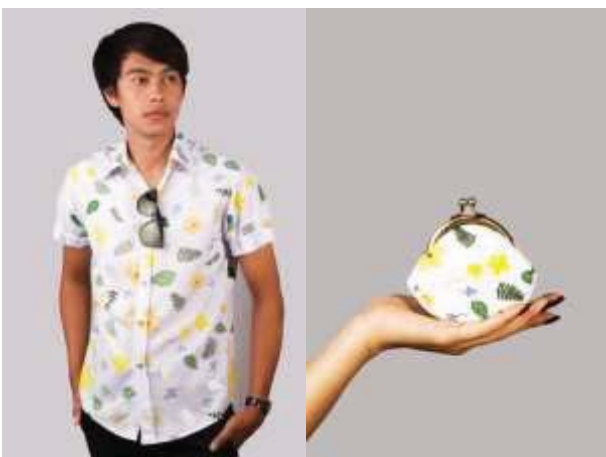
ภาพที่ 19 ต้นแบบผลิตภัณฑ์จากลายแบบที่ 2

ลายแบบที่ 2 ผลิตเสื้อเชิ้ต กระเป๋าเก็บเหรียญ