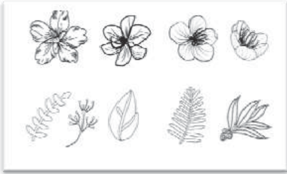
ภาพที่ 5 ลวดลายลวดลายแบบที่ 2