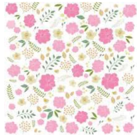
ภาพที่ 4 ลวดลายแบบที่ 1.2

ออกแบบลวดลายกราฟิกของที่ระลึกแรงบันดาลใจจากพืชพรรณ ในวนอุทยานแห่งชาติกุยออลม เหมาะสำหรับกลุ่มคนรุ่นใหม่ที่มีอายุ 20-35 ปี ผู้ที่สนใจในผลิตภัณฑ์ที่มาจากภูมิปัญญาวัฒนธรรมท้องถิ่นได้นำพืชพรรณไม้ในวรรณคดีมาเป็นแรงบันดาลใจ มาประยุกต์ใช้บนผลิตภัณฑ์ผ้า ได้แก่ เสื้อยืด เสื้อเชิ้ต หมวก ผ้าพันคอ กระเป๋าเป้ กระเป๋าเก็บเหรียญ ออกแบบโดยใช้สไตล์อาร์ตแอนคราฟ (Art and craft) มีการตัดทอนรูปแบบให้เรียบง่าย จัดวางรูปแบบลวดลายเป็นแพทเทิร์นน้อยใหญ่ตามความเหมาะสมของผลิตภัณฑ์