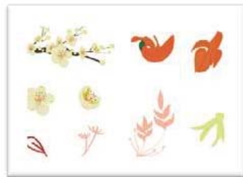
ภาพที่ 9 ลวดลายแบบที่ 3.1