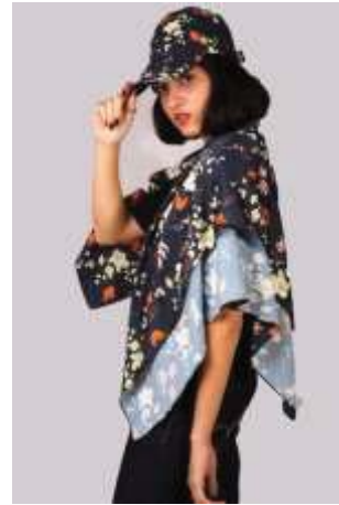
ภาพที่ 20 ต้นแบบผลิตภัณฑ์จากลายแบบที่ 3

ลายแบบที่ 1 นำมาผลิตเสื้อยืด หมวกปีกครอบ ผ้าพันคอ และลายแบบที่ 5 ผลิตกระเป๋าใบ