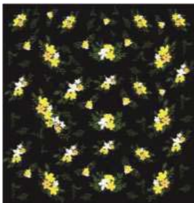
ภาพที่ 13 ลวดลายแบบที่ 4.2