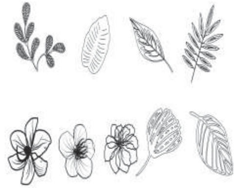
ภาพที่ 14 ลวดลายแบบที่ 5