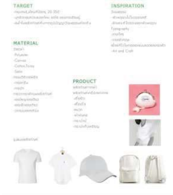
ภาพที่ 1 แผนผังการวิเคราะห์ข้อมูลเพื่อการออกแบบ

วางลายบนกระเป่าผู้ทรงคุณวุฒิแนะนำทั้งเฉพาะจุดและเต็มใบเพื่อความเป็นเอกลักษณ์และแปลกใหม่ สำหรับการวางลายบนผ้าพันคอผู้ทรงคุณวุฒิแนะนำลวดลายประกอบตัวอักษรเพื่อสร้างความจดจำแก่สถานที่ ส่วนหมวกผู้ทรงคุณวุฒิแนะนำให้วางเฉพาะจุดเช่น ด้านหน้า ด้านหลัง และด้านข้าง และการออกแบบพวงกุญแจผู้ทรงคุณวุฒิแนะนำลวดลายประกอบเพื่อความแปลกใหม่