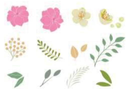
ภาพที่ 3 ลวดลายแบบที่ 1.1