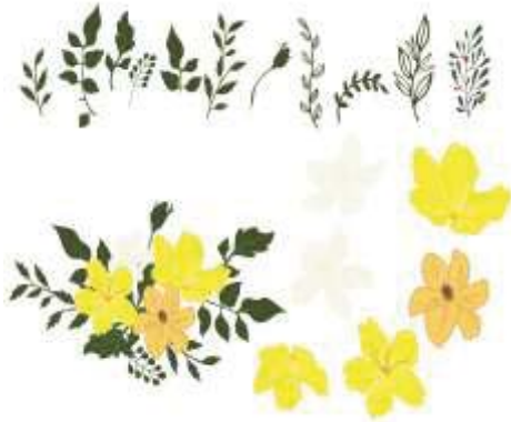
ภาพที่ 12 ลวดลายแบบที่ 4.1