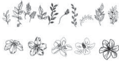
ภาพที่ 11 ลวดลายแบบที่ 4