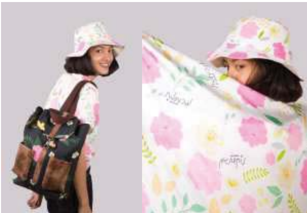
ภาพที่ 18 ต้นแบบผลิตภัณฑ์จากลายแบบที่ 1 และ 5

ลายแบบที่ 1 นำมาผลิตเสื้อยืด หมวกปีกครอบ ผ้าพันคอ และลายแบบที่ 5 ผลิตกระเป๋าใบ