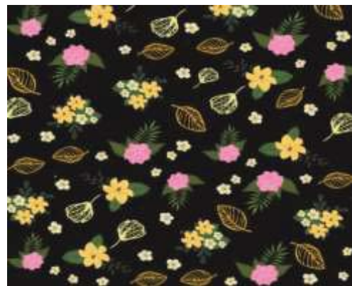
ภาพที่ 16 ลวดลายแบบที่ 5.2

5. ลวดลายแบบที่ 5 เป็นรูปแบบกราฟิกที่ ออกแบบโดยการถอดรูปมาจากดอกทรงบาดาล ดอก กระพี้จั่น ซึ่งเป็นดอกไม้ในวรรณคดี และยังมีดอกนนทรี ดอกมะขามป้อม ที่นำมาประกอบ มีทั้งหมดสี่ดอก นำมา ตัดทอนเป็นรูปแบบกราฟิกและมีลายละเอียดของดอกไม้ โดยใช้โทนสี ขาว เขียว เหลือง ชมพู ของดอกทรงบาดาล นำกราฟิกมาจัดวางเป็นแพทเทิร์น พัฒนาเป็นผลิตภัณฑ์ กระเป๋าเป้