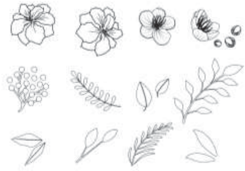
ภาพที่ 2 ลวดลายแบบที่ 1