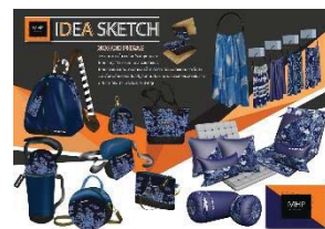
ภาพที่ 1 ขั้นตอนการทำ Idea Sketch