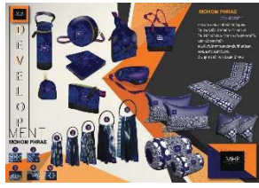
ภาพที่ 2 ขั้นตอนการทำ Develop การเก็บรวบรวมข้อมูล

ในการศึกษาวิจัยการศึกษารูปแบบและ สร้างสรรค์ผลิตภัณฑ์จากผ้าหม้อห้อมครั้งนี้ ผู้วิจัยได้ดำเนินการเก็บรวบรวมข้อมูลตาม ขั้นตอนนี้