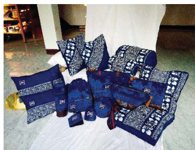
ภาพที่ 5 ผลิตภัณฑ์ที่สมบูรณ์

ในด้านกรรมวิธีการผลิต ผลิตภัณฑ์จากผ้าหม้อ ห้อม ได้นำหลักการประเมินวัสดุมาใช้ในการ เลือกส่วนประกอบและเทคนิคการผลิตขึ้นรูป ของผลิตภัณฑ์โดยการหารูปทรงที่เหมาะสม ก่อนทำการผลิตต้องมีวัสดุและเครื่องมือที่ เหมาะสมในการผลิตเพื่อให้รูปแบบที่น่าสนใจ ถูกใจผู้ใช้ ดูแปลกใหม่และสร้างจินตนาการ