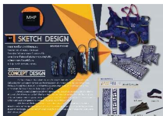
ภาพที่ 3 ขั้นตอนการทำ Sketch Design การวิเคราะห์ข้อมูล

การวิเคราะห์ข้อมูลผู้วิจัยนำข้อมูลที่เก็บ รวบรวมได้มาตรวจสอบความสมบูรณ์ของ แบบสอบถาม ทุกฉบับโดยเลือกเฉพาะฉบับที่ สมบูรณ์มาทำการ วิเคราะห์ข้อมูลเพื่อหา ประสิทธิภาพของผลิตภัณฑ์ต่อไป