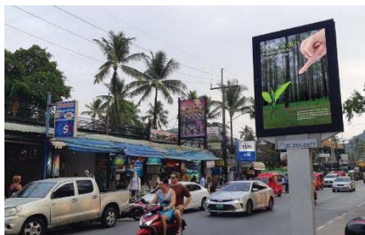
ภาพที่ 5 ตัวอย่างสื่อรูปแบบโปสเตอร์