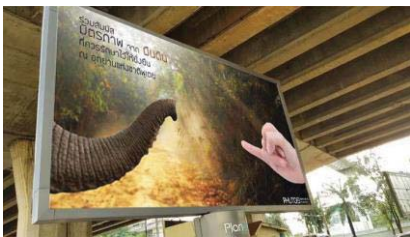
ภาพที่ 4 ตัวอย่างสื่อรูปแบบบิลบอร์ด