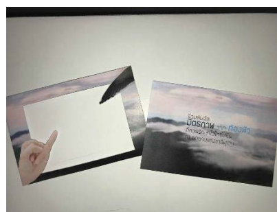
ภาพที่ 1 ตัวอย่างสื่อรูปแบบโปสเตอร์

4. การออกแบบสื่อประชาสัมพันธ์การ ท่องเที่ยวเชิงอนุรักษ์ พบว่าผู้ตอบแบบสอบถามมี ความต้องการให้ออกแบบสื่อประชาสัมพันธ์ใน รูปแบบสื่อต่างๆ เช่น แผ่นพับ โปสเตอร์ บิลบอร์ด โปสเตอร์