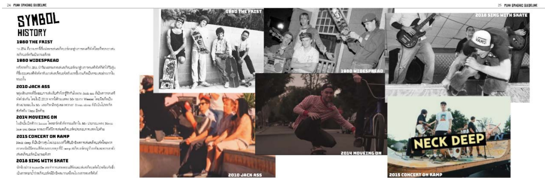
ภาพตัวอย่างที่ 4