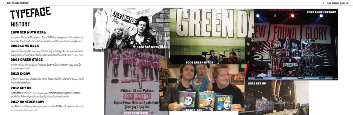
ภาพตัวอย่างที่ 2