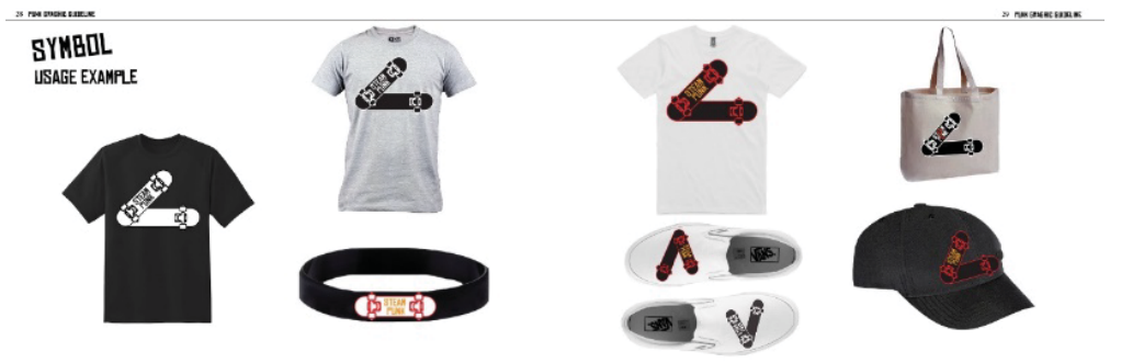
ภาพตัวอย่างที่ 6