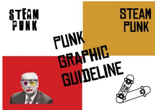
ภาพตัวอย่างที่ 1