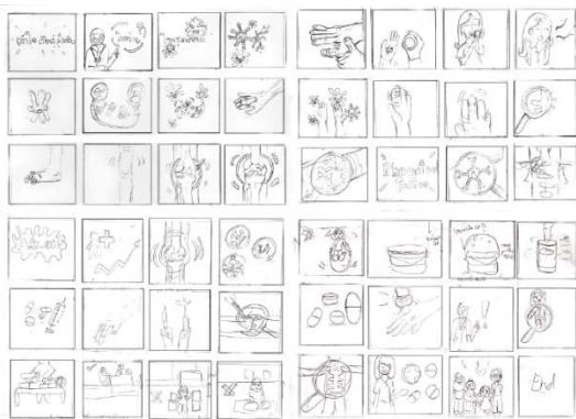
ภาพที่ 2 ภาพประกอบคอมพิวเตอร์ตัวละครเล่าเรื่อง