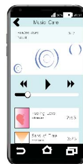
ภาพที่ 3 ลักษณะ Ui ของแอปพลิเคชัน