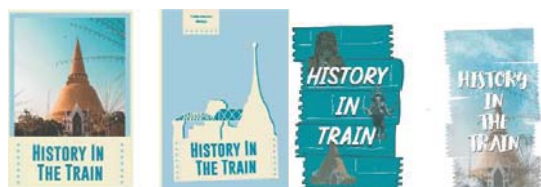
ภาพที่ 2 แบบร่างหน้าปกหนังสือคู่มือท่องเที่ยว