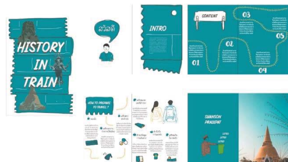
ภาพที่ 4 แบบร่างภาพรวมหนังสือคู่มือท่องเที่ยว แบบที่ 2