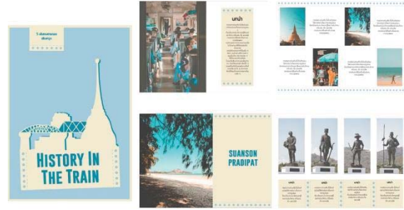
ภาพที่ 3 แบบร่างภาพรวมหนังสือคู่มือท่องเที่ยว แบบที่ 1