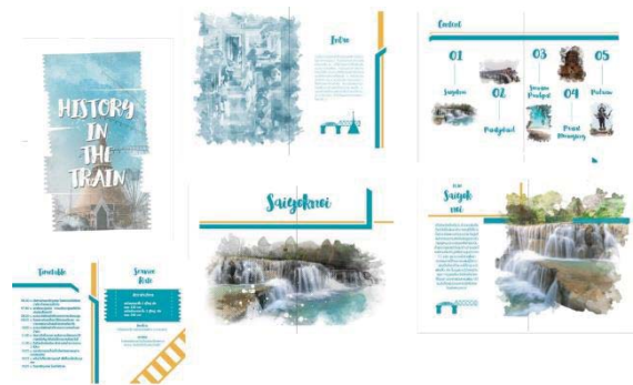
ภาพที่ 5 แบบร่างภาพรวมหนังสือคู่มือท่องเที่ยว แบบที่ 3