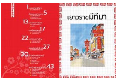
ภาพที่2.4 การจัดวาง Layout ด้านในหนังสือแบบคอมพิวเตอร์