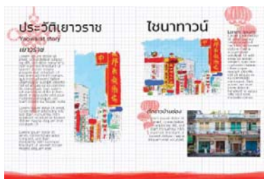
ภาพที่2.2 การจัดวาง Layout ด้านในหนังสือแบบคอมพิวเตอร์