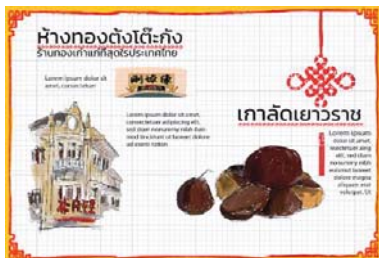
ภาพที่2.3 การจัดวาง Layout ด้านในหนังสือแบบคอมพิวเตอร์