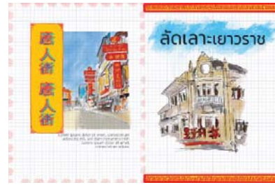
ภาพที่2.5 การจัดวาง Layout ด้านในหนังสือแบบคอมพิวเตอร์