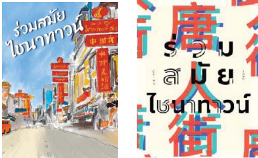
ภาพที่2.1 ปกหนังสือเป็นลงสีในคอมพิวเตอร์

น้อยและคาเฟ่หรือแกลลอรีถ่ายรูป และสอดแทรกประวัติความเป็นมาของแต่ละสถานที่หรือจุดกำเนิดให้มีความร่วมสมัยของคนเชียงใหม่