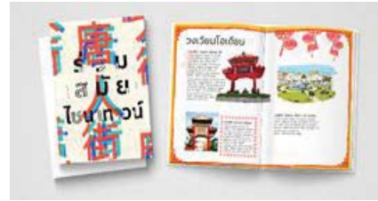
ภาพที่3.1 ภาพแสดงตัวอย่างหน้าปกหนังสือและเนื้อหาภายในหนังสือในรูปแบบจริง