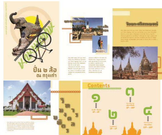
ภาพที่ 2 ภาพสเก็ตคอมพิวเตอร์สื่อส่งเสริมการท่องเที่ยว