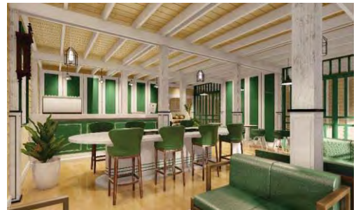
รูปที่ 15 ภาพสามมิติพื้นที่ส่วนกลางที่เป็น คอร์ทยาร์ด