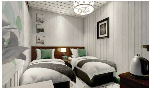
รูปที่ 16 ภาพสามมิติแสดงพื้นที่ภายในห้องพัก