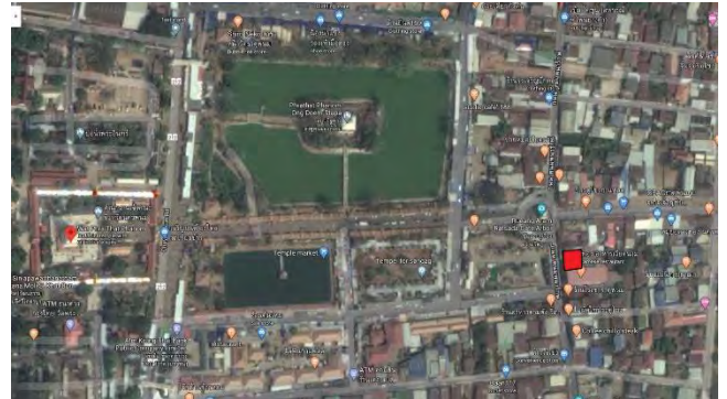
รูปที่ 2 แผนที่ Google (2562) แสดงตำแหน่งที่ตั้งโครงการในอำเภอธาตุพนม จังหวัดนครพนม

พระธาตุพนม ประมาณ 500 เมตร ก็สามารถเดินจากโครงการไปถึงวัดได้