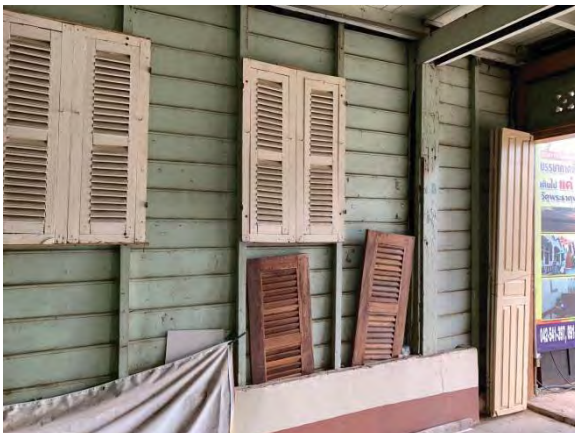
รูปที่ 7 สภาพภายในอาคารโรงแรมแสงทอง

จะเห็นได้ว่าปัจจุบัน อาคารถูกต่อเติม และปรับเปลี่ยนไปตามการใช้สอยของครอบครัว เจ้าของโครงการผู้อยู่อาศัย เช่นต่อเติมหลังคาในส่วนกลางของอาคารเพื่อบังแดด และสร้างอาคารปูนด้านข้างเพื่อการพักอาศัย โดยเมื่อวิเคราะห์โดยละเอียดตามหลักการก่อสร้างและการทำโรงแรมเชิงพาณิชย์ จำจะต้องมีการรีโนเวทในส่วนต่อเติม เพื่อให้เกิดประโยชน์ใช้สอยให้เหมาะสมกับความ เป็นโรงแรมตามมาตรฐานสากล โดยหลังจากปรึกษากันกับทางเจ้าของโครงการอนุญาตให้รีโนเวทตามความเหมาะสมได้เต็มที่ เนื่องจากการต่อ