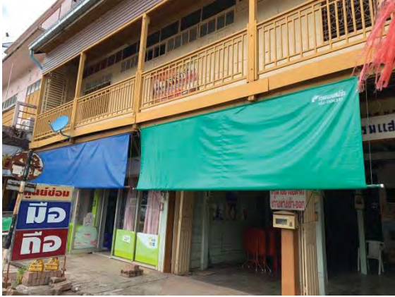
รูปที่ 5 สภาพปัจจุบันโรงแรมแสงทองด้านหน้าอาคาร