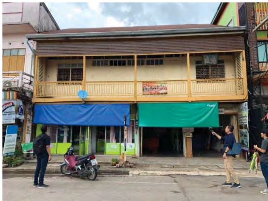
รูปที่ 1 ภาพโรงแรมแสงทองในปัจจุบัน

“โรงแรมแสงทอง” ถ้าเป็นคนในจังหวัดนครพนมริมฝั่งแม่น้ำโขง จะต้องรู้จักโรงแรมแห่งนี้อย่างแน่นอน เรียกได้ว่าเป็นโรงแรมแห่งแรกแห่งอำเภอธาตุพนมเลยก็ว่าได้ (นที, 2561) โรงแรมแสงทองเปิดขึ้นเมื่อ ปีพ.ศ. 2498 เป็นอาคารไม้ 2 ชั้น ด้านหลังเป็นอาคารปูน 2 ชั้นเป็นส่วนพักอาศัย อาคารหลังนี้เคยเป็นโรงแรมที่มีชื่อเสียงเป็นที่รู้จักในระดับจังหวัดนครพนมเป็นอย่างมาก เรียกได้ว่าเป็นโรงแรมที่ได้รับการกล่าวถึงในหนังสือ The Rough guild Thailand