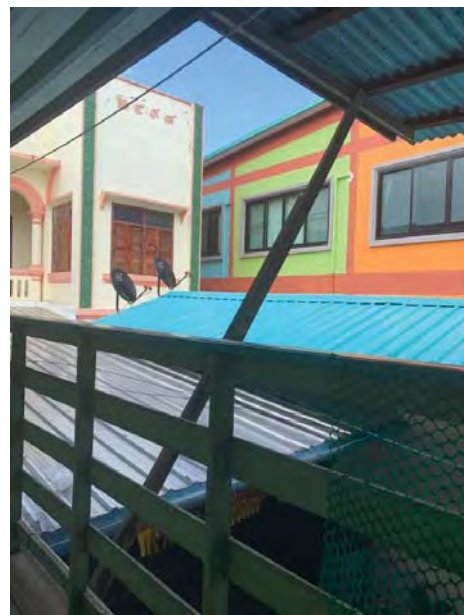
รูปที่ 9 สภาพภายในอาคารโรงแรมแสงทอง