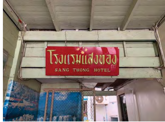
รูปที่ 8 สภาพภายในอาคารโรงแรมแสงทอง