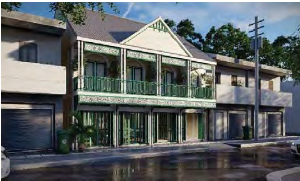
รูปที่ 13 ภาพสามมิติหลังจากปรับปรุงโรงแรมแสงทอง