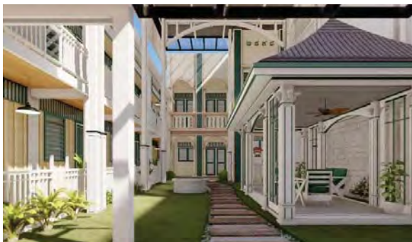
รูปที่ 14 ภาพสามมิติพื้นที่ใช้สอยในรูปแบบคาเฟ่