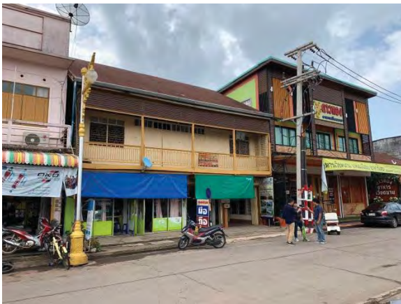
รูปที่ 6 สภาพปัจจุบันโรงแรมแสงทองด้านหน้าอาคารมุกกว้าง