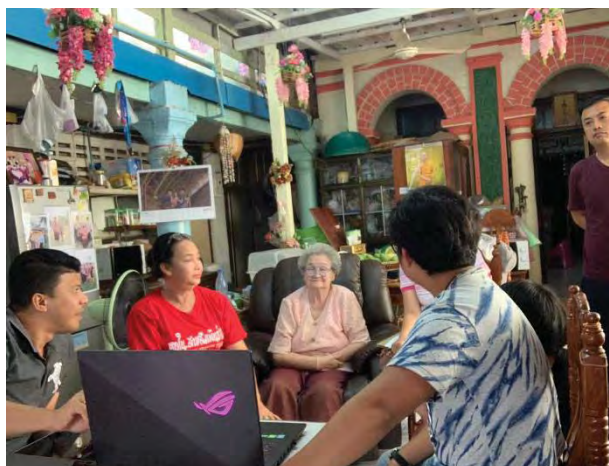
รูปที่ 10 ภาพการนำเสนองานกับเจ้าของโครงการและคนในครอบครัว

เติมในหลายๆส่วนขึ้นเพราะหลายๆคนในครอบครัวยังอาศัยอยู่ในอาคารหลังนี้ (อาคารก่ออิฐถือปูนด้านหลัง) เมื่อนานเข้าจึงต้องต่อเติมเพื่อตอบสนองกับการขยายตัวของครอบครัว โดยขณะที่ทำการรื้อถอนทางครอบครัวและเจ้าของโครงการ จะทำการย้ายไปอยู่ที่บ้านใกล้ๆกันก่อนเพื่อความปลอดภัยในการก่อสร้าง