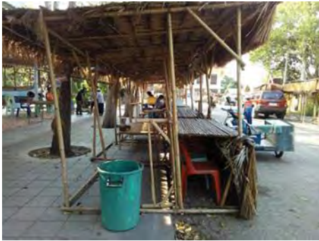
ภาพที่ 5 ปัญหาร้านค้าตั้งขายของอยู่บนทางเท้า