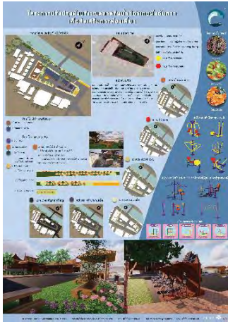
ภาพที่13 แผนนำเสนอที่2