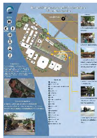
ภาพที่ 12 แผ่นนำเสนอที่ 1