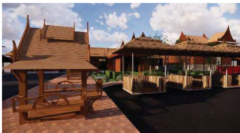
ภาพที่22 แสดงโซนร้านค้าขายของที่ระลึก