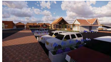
ภาพที่19 แสดงที่จอดรถยนต์