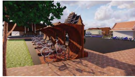
ภาพที่18 แสดงที่จอดรถจักรยาน