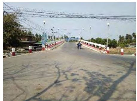
ภาพที่ 7 ปัญหาเส้นทางเข้า-ออก ขาดการจัดระเบียบที่ชัดเจน

สำหรับผลการวิเคราะห์จากแบบสอบถามทั้งหมด จำนวน 133 ชุด มีการตอบกลับ 50% โดยมี รายละเอียดหัวข้อที่สอบถามดังนี้