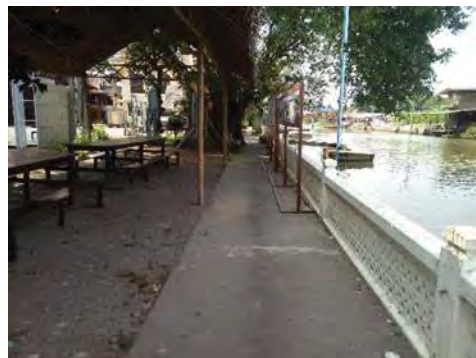
ภาพที่ 9 ศาลาสำหรับนั่งชมริมน้ำ