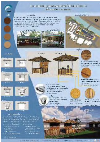
ภาพที่14 แผนนำเสนอที่3