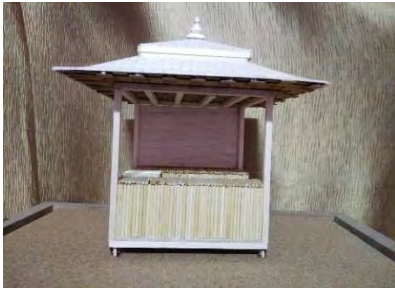
ภาพที่ 17 หุ่นจำลองแบบขยายร้านค้า

ที่ไม่รับน้ำหนักมากเช่น เสา,นั่งร้าน เป็นต้น สามารถนำไปประยุกต์ใช้ในงานทั่วไปทดแทนการใช้ไม้คอนกรีต และเหล็กรูปพรรณชนิดอื่นๆ น้ำหนักเบา และมีคุณสมบัติที่แข็งแรงทนทาน (ใช้ในส่วนของโครงสร้างเสา)