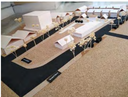
ภาพที่15 หุ่นจำลองผังบริเวณ