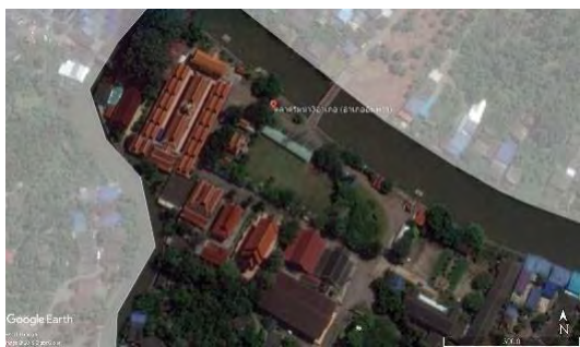
รูปที่ 1 แผนที่ตลาดริมน้ำ 3 อำเภอฝางอัมพวา

ตำแหน่งพื้นที่ตลาดริมน้ำ 3 อำเภอฝางอัมพวา ตั้งอยู่ที่ตำบลวัดประดู่ อำเภออัมพวา สมุทรสงคราม ทำการวิจัยเชิงสำรวจ (Survey Research) เพื่อศึกษาสภาพของพื้นที่ตลาดริมน้ำ 3 อำเภอฝางอัมพวาทั้งหมด จากนั้นจะเก็บข้อมูลจากแบบสอบถามและแบบสัมภาษณ์ เพื่อนำมาสรุปผลสำหรับการสำรวจลักษณะทางกายภาพตลาดริมน้ำ 3 อำเภอ ฝางอัมพวา