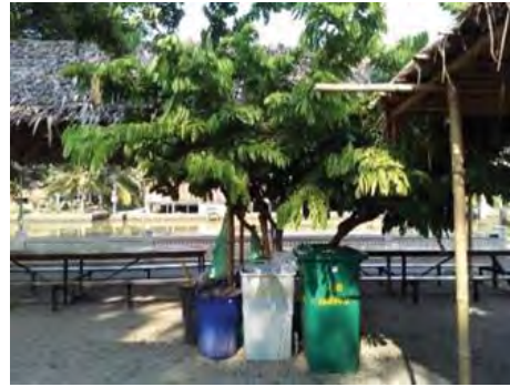
ภาพที่2 ปัญหาจุดทิ้งขยะมีจำนวนน้อย

1.4 เนื่องจากร้านค้าตลาดริมน้ำ 3 อำเภอฝางอัมพวา ตั้งขายของอยู่บนทางเดินเท้าจึงทำให้ต้องมีการจัดระเบียบทางเดินเท้าเพื่อให้นักท่องเที่ยวและบุคลากรสามารถเดินบนทางเดินเท้าได้อย่างปลอดภัยเพื่อป้องกันไม่ให้เกิดอุบัติเหตุบนเส้นเข้า-ออกของรถได้