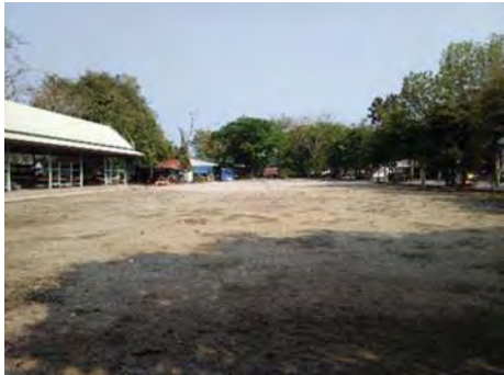
ภาพที่ 6 ปัญหาขาดการจัดระเบียบพื้นที่ลานจอดรถ