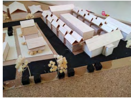
ภาพที่16 หุ่นจำลองผังบริเวณ

3. หุ่นจำลองแบบขยายร้านค้า โดยร้านค้าแบ่งตามประเภทของรูปแบบร้าน