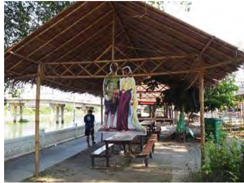
ภาพที่ 8 ศาลาสำหรับนั่งชมริมน้ำ