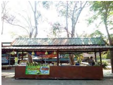
ภาพที่ 4 ร้านค้าในตลาดริมน้ำ 3 อำเภอฝางอัมพวา