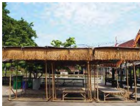
ภาพที่ 3 ปัญหาร้านค้าไม่แข็งแรงคงทนและขาดเอกลักษณ์ประจำตลาด