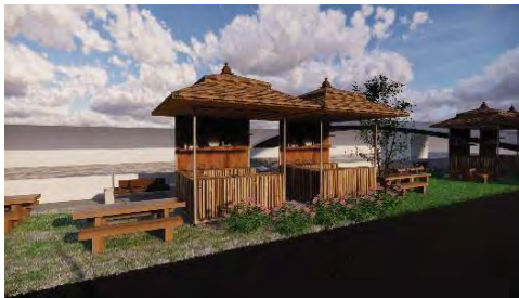
ภาพที่21 แสดงโซนร้านค้าขายอาหารคาว

ชั่วคราว เนื่องจากต้องมีพื้นที่ในการปรุงอาหาร ทำความสะอาดจานชามและอุปกรณ์ทำอาหาร เป็นการปรับปรุงเพื่อสร้างเอกลักษณ์เพิ่มความน่าสนใจจากตัวร้านค้า พาณิซยกรรม โดยการนำวัสดุธรรมชาติคือไม้ไผ่มาประยุกต์กับวัสดุที่หาได้ง่ายคือไม้ไผ่สานลามิเนต ไม้เทียมไฟเบอร์ซีเมนต์ หลังคาซิงเกิ้ล เหล็กกล่องและล้อเลื่อน ให้ได้ถึงกลิ่นอายของธรรมชาติและวิถีชีวิต เพื่อยกระดับการท่องเที่ยวเชิงวัฒนธรรมใน ตลาดริมน้ำ 3 อำเภอฝางอัมพวา และส่งเสริมให้มีนักท่องเที่ยวเข้ามาเที่ยวชมและจับจ่ายซื้อสินค้าภายในตลาดริมน้ำ 3 อำเภอฝางอัมพวา และเมื่อมีนักท่องเที่ยวเข้ามาเพิ่มขึ้นจะทำให้ตลาดริมน้ำ 3 อำเภอฝางอัมพวาเป็นที่รู้จักมากขึ้น คนในชุมชนเกิดรายได้จากการนำสินค้ามาขาย เกิดกิจกรรมต่าง ๆ ภายในตลาดริมน้ำ 3 อำเภอฝางอัมพวา