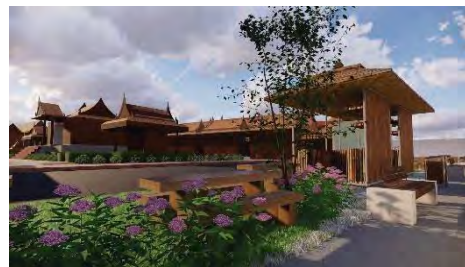
ภาพที่20 แสดงโซนขายอาหารและที่นั่งพักผ่อน

2. หุ่นจำลองผังบริเวณ จำลองภาพให้เห็นถึงแนวคิดในการปรับปรุงผังบริเวณและทัศนียภาพโดยรอบของตลาดริมน้ำ 3 อำเภอฝางอัมพวา มีที่ทำการปรับปรุงคือ ทางเข้า-ออกของที่จอดรถ แยกประเภทของที่จอดรถ สนามเด็กเล่น ที่ออกกำลังกาย โซนขายอาหาร ที่นั่งพักผ่อน จุดที่ทิ้งขยะ