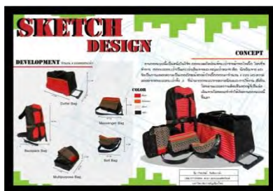
ภาพที่ 2 ต้นแบบการออกแบบชุดกระเป๋า