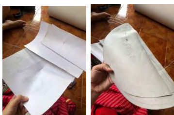
ภาพที่ 3 คือการ patten กระเป๋าโดยใช้กระดาษ