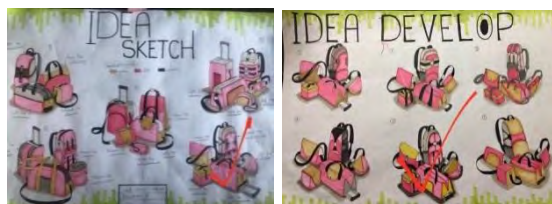
ภาพที่ 1 ขั้นตอนการออกแบบชุดกระเป๋า 1

ตารางค่าเฉลี่ยวิเคราะห์ความพึงพอใจทั้ง 3 ด้านได้แก่ ข้อมูลด้านประโยชน์ใช้สอย การใช้งานได้